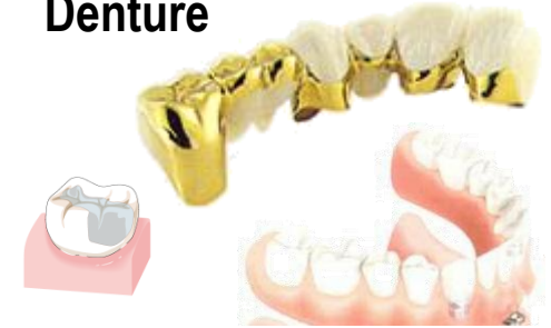
クラウン ブリッジ デンチャー