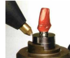
ジルコニア&アルミナス コーピング

優れた審美性と強度を兼ね備えた「プロセラ コーピング」は99.5%の酸化アルミニウムを主材料に、2トンの圧力と、1700度の高温焼結により製作されます。この高密度な焼結酸化アルミニウムは687Mpaという優れた曲げ強度をもつ最初のCAD/CAMシステムです。