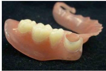
ノンクラスプ デンチャー

使用される日本製樹脂は厚生労働省認可（認証番号 20800BZZ00194000）済みです。輸入代行依頼書作成など、面倒な手続きはありません。