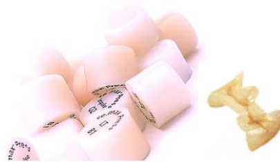
ベルプレス セラミックス

歯科用セラミックファーマスからプレス形成されるニケイ酸リチウムガラスセラミックスのペレットは、400Mpaの強度と審美性から、単独歯のクラウンやインレイの修復に適しています。