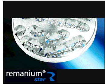
プロセラコバルト「ゼロフリー」

CAD/CAMによりコバルトクロムブロックから削り出されるフレームは、金属代金が無料です。またニッケル、カドミウム、ベリリウムを含みません。つまり、金属代金「ゼロ」、有害成分「フリー」なのです。コバルトクロム合金は耐食性に優れ、金属イオンの溶出も抑えられます。